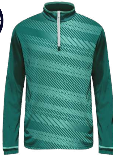
SWEAT 1/4 DE ZIP 100% polyester Speedo brushed polyester gratté intérieur 280gsm réf. S42