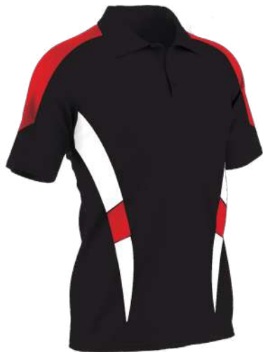
POLO COL 3 BOUTONS