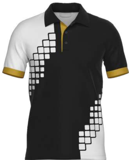
POLO COL 3 BOUTONS 100% polyester alvéolaire dryfit 150 gsm réf. SPCP1