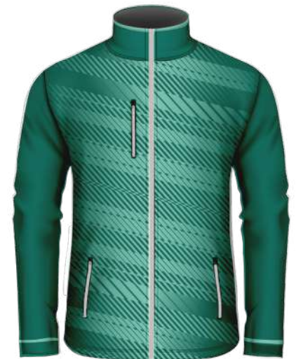
VESTE SOFTSHELL 100% polyester softshell 330 gsm réf. SAS70 Manches Amovibles réf. SAS71