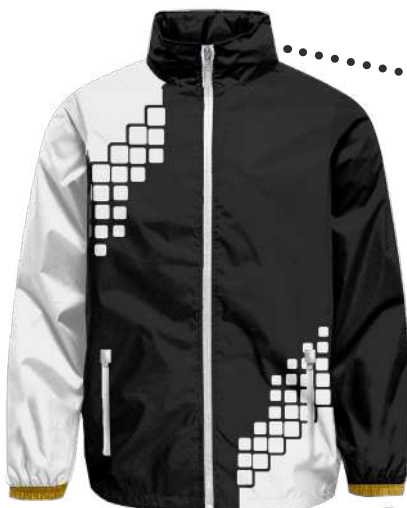
VESTE PLUIE 330D TASLAN = 100% polyester 330D et 120 gms Doublure MESH réf. S32