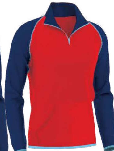
SWEAT 1/4 ZIP

100% polyester French Terry gratté bouclette intérieur - 280 gsm