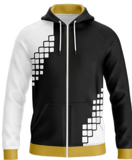
VESTE CAPUCHE 100% polyester Speedo brushed polyester gratté intérieur 280gsm réf. S29