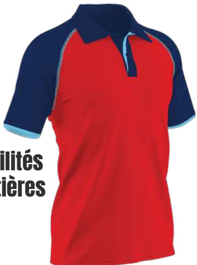
POLO COL 3 BOUTONS