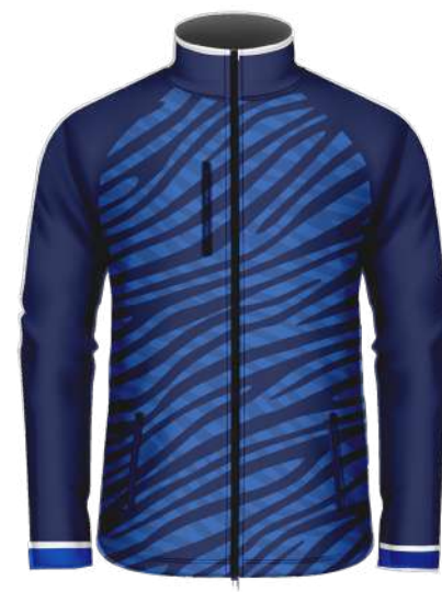
VESTE SOFTSHELL 100% polyester softshell 330 gsm réf. SAS70 Manches Amovibles réf. SAS71