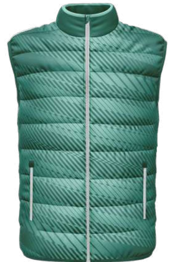
DOUDOUNE Matelassée KF = 100% Korean nylon PU 75gsm Doublure matelassée 150gsm réf. S90