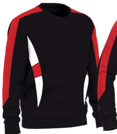
SWEAT COL ROND

65% polyester / 35% coton - gratté intérieur - 320 gsm