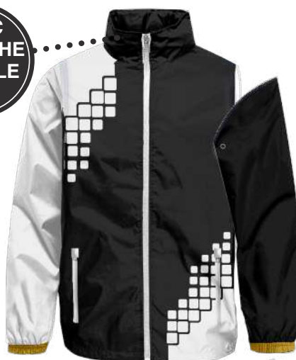
VESTE PLUIE Manches Amovibles 330D TASLAN = 100% polyester 330D et 120 gms Doublure MESH réf. S33