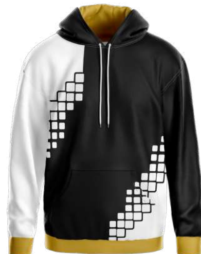
SWEAT CAPUCHE 100% polyester Speedo brushed polyester gratté intérieur 280gsm réf. S28