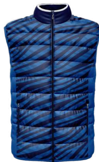
DOUDOUNE Matelassée KF = 100% Korean nylon PU 75gsm Doublure matelassée 150gsm réf. S90