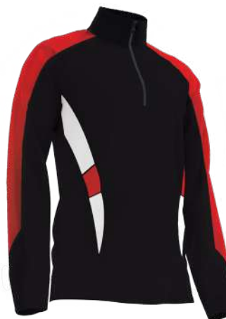
SWEAT 1/4 ZIP