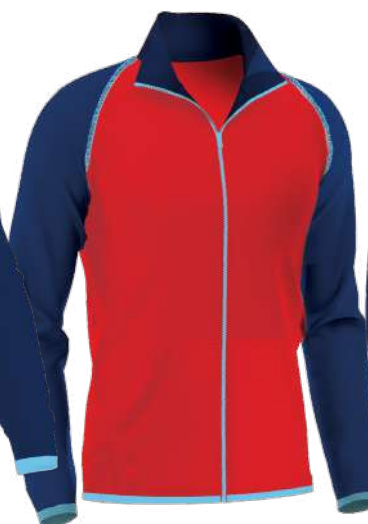
VESTE sans CAPUCHE

100% polyester French Terry gratté bouclette intérieur - 280 gsm