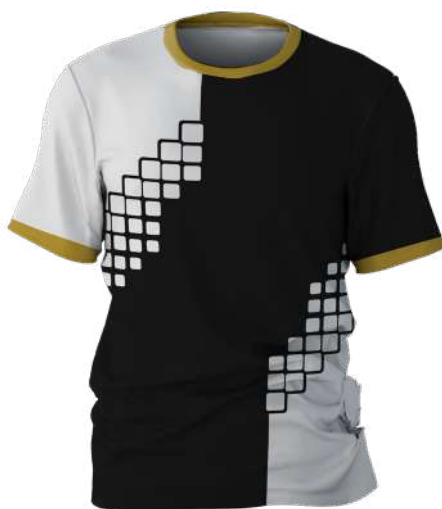
TEE-SHIRT 100% polyester alvéolaire dryfit 150 gsm réf. SIMCP1