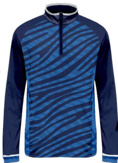
SWEAT 1/4 DE ZIP 100% polyester Speedo brushed polyester gratté intérieur 280gsm réf. S42