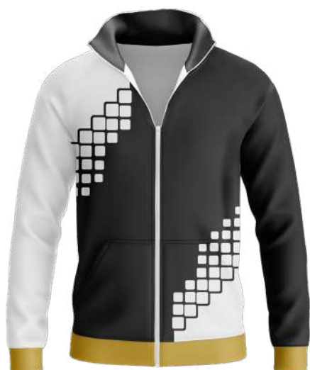
VESTE 100% polyester Speedo brushed polyester gratté intérieur 280gsm réf. S26